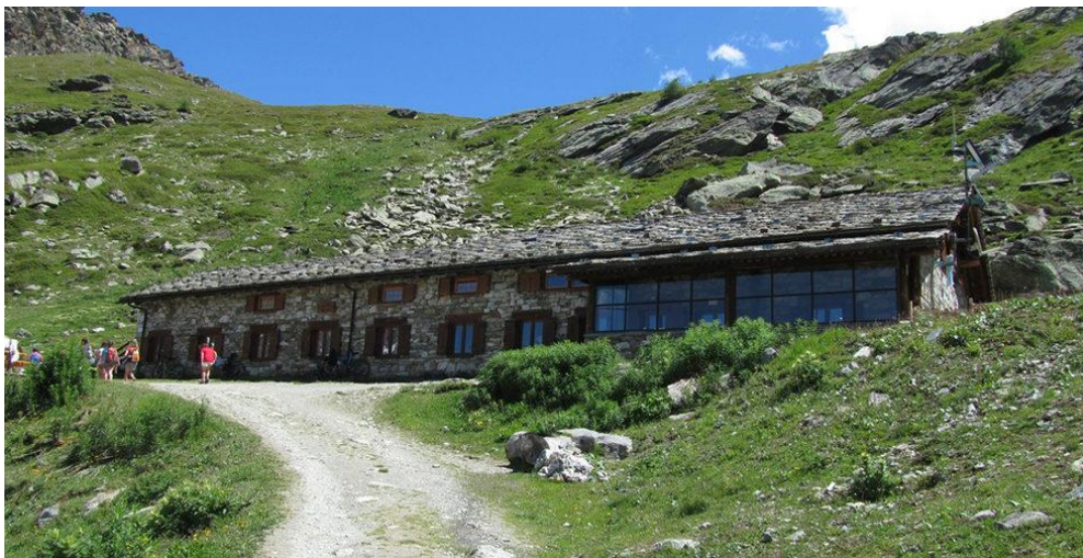
rifugio Chalet de l'Epée posto lungo l'Alta Via n°2 della Val d'Aosta.

Conosciuta, ma non molto frequentata, questo la rende unica.