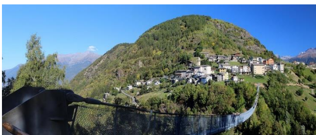
Il Ponte nel Cielo

Attraversato il ponte, passeremo dal bivacco Frasnino dove imbrocheremo il sentiero 163 (segnale bianco-rosso) che prosegue in direzione sud-est, costeggiando con moderata pendenza ed in mezzo al bosco, la valle del torrente Tartano.