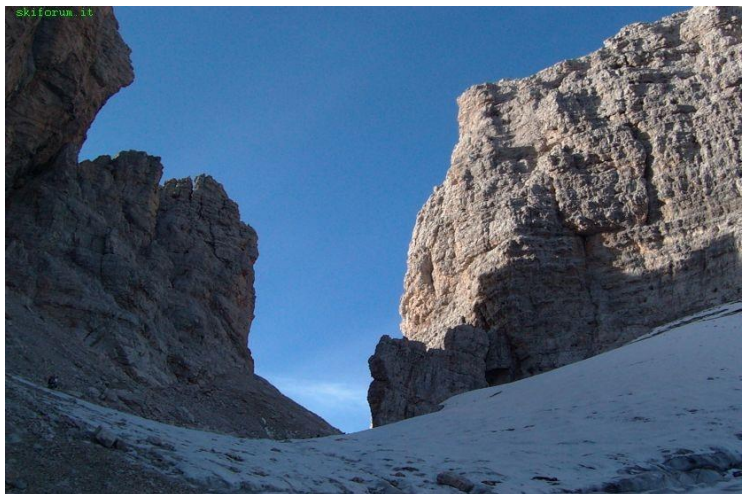
in basso PARTENZA BOCCHETTE CENTRALI