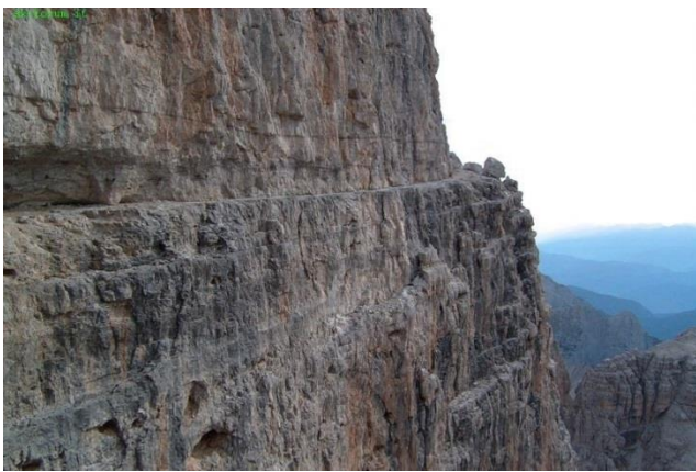
sopra CENGIA ESPOSTA