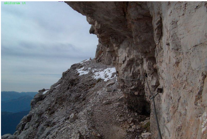
a sinistra CENGIA ALTA

Note tecniche: possibilità di trovare passaggi innevati da affrontare con ramponi.